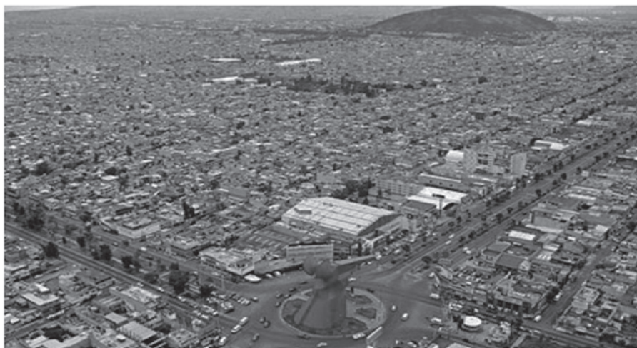
Traza urbana del municipio de Nezahualcóyotl

La estructura vial está formada por una cuadrícula casi perfecta. En la zona centro, las principales vialidades del Municipio son: de oriente a poniente, Avenida Texcoco, Pantitlán, Chimalhuacán, Cuarta Avenida, Bordo de Xochiaca. De sur a norte, Calle 7, Avenida Cuauhtémoc, Vicente Rivapalacio, Nezahualcóyotl, Adolfo López Mateos, Sor Juana, Vicente Villada, Carmelo Pérez, Tepozanes y de Los Reyes. Se