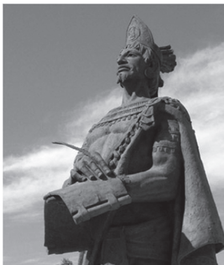
Monumento en honor a Nezahualcōyotl

En aquellos años, la ciudad de México, que sólo contaba con un millón 500 mil habitantes, estaba ávida de mano de obra barata que impulsara el progreso, tanto de las nuevas fábricas como de las ya existentes, además de pequeños talleres y servicios, a los que sin dificultad pudieron integrarse los nuevos residentes. Sin embargo, la capacidad y calidad de vivienda no era la idónea para hospedar a los emigrantes por lo que se elevó su precio dejando a éstos con mínimos recursos para sostener a sus familias y posponiendo los anhelos de superación.