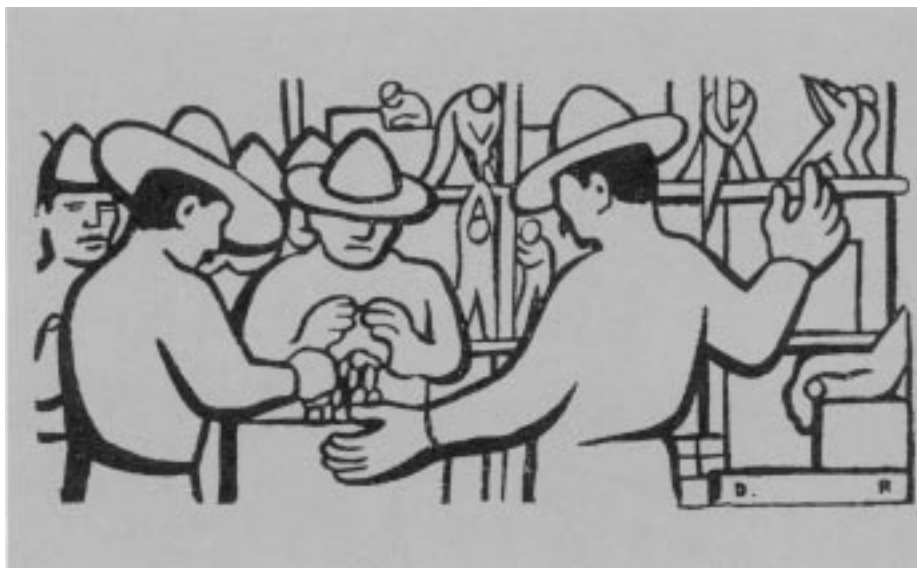
Ilustración de la Memoria de la Tercera Convención de la Liga de Comunidades Agrarias y Sindicatos Campesinos del Estado de Tamaulipas , Diego Rivera (1928). Tomado de: Diego Rivera Ilustrador , SEP, México, 1986.

Posición sectaria que no ayudó a una labor efectiva ni a una comprensión amplia del problema. Indudablemente, la presión interna era mucha y la influencia externa determinante. La primera se refleja principalmente por la intensa represión hacia las actividades del partido y de sus centrales. Hemos dicho que la CSUM tenía mayor margen de acción que el propio partido. Con todo, sus oficinas son asaltadas el 16 de diciembre de 1930, su material destruido y varios militantes aprehendidos. Nuevamente asaltada entre el 10 y 11 de mayo de 1931, su Conferencia Nacional fue asaltada el 7 de abril de 1933. Su sección en el Distrito Federal, la Cámara de Trabajo Unitaria del Distrito Federal, fue asaltada el 13 de marzo de 1931, el 24 de