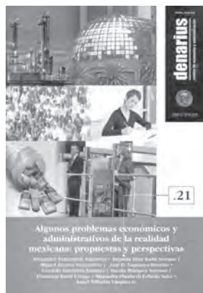
Denarius. Revista de Economía y Administración, núm. 21, noviembre de 2010 Algunos problemas económicos y administrativos de la realidad mexicana: propuestas y perspectivas