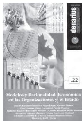
Denarius. Revista de Economía y Administración, núm. 22, marzo de 2011 Modelos y racionalidad económica en las organizaciones y el Estado