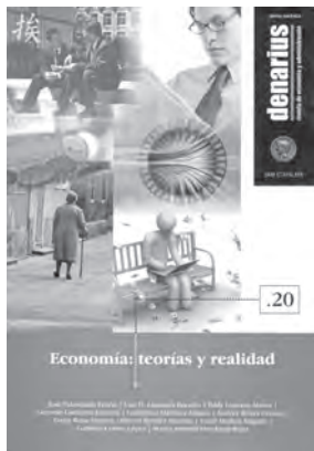
Denarius. Revista de Economía y Administración, núm. 20, marzo de 2010 Economía: teorías y realidad